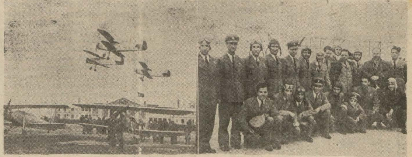
Diploma alan genç havacılar ve yaptıkları uçuşardan bir görünüşü

Yeni diploma alan genç havacılar takdirle seyredilen uçuş ar yaptılar, halktan da arzu edenler uçurdu